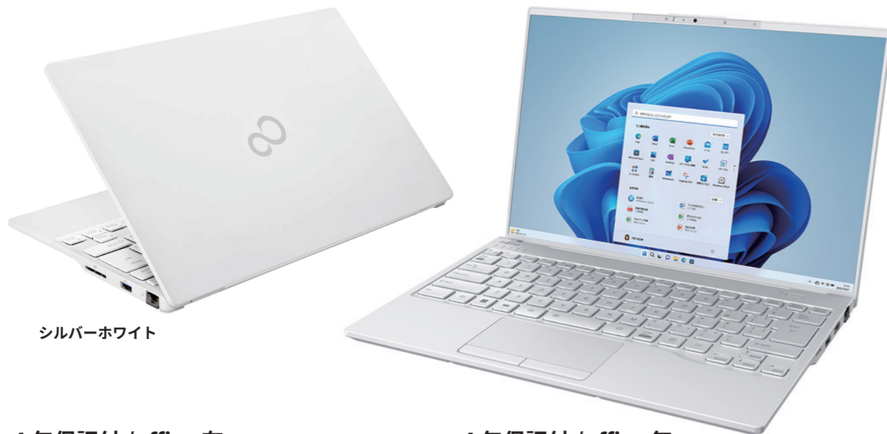
シルバーホワイト